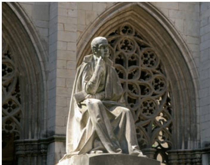
Mausoleu de Balmes al claustre de la catedral de Vic

no existia: «En aquesta obra es fa un assaig per a dirigir les facultats de l'esperit humà mitjançant un sistema diferent del seguit fins ara.»