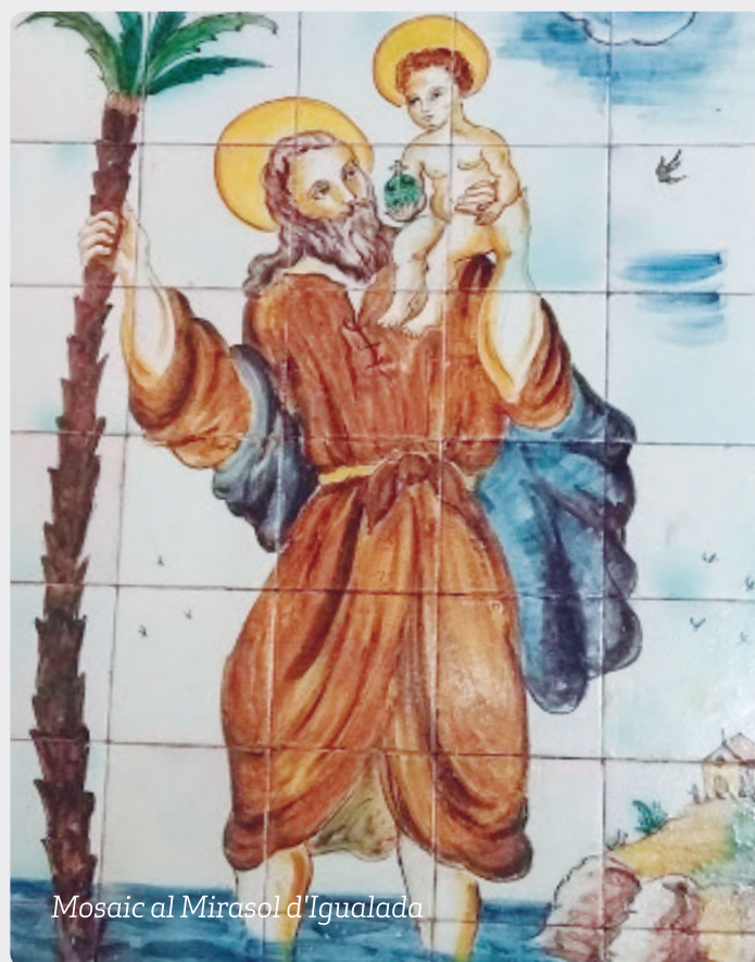
Mosaic al Mirasol d'Igualada

Tot i que no vull prendre cap protagonisme a sant Cristòfol –del qual penso que sóc bon amic–, voldria també promoure juntament amb ell la devoció a l'arcàngel sant Rafael, que té amb el tema dels viatges una mà especial. Us convido a llegir el llibre bíblic de Tobit, en el qual apareix com Rafael, nom que significa «medicina de Déu», fou company de camí de Tobies, fill de Tobit, en la recerca del que el seu pare, cec, li havia encomanat. Fou tan bona la companyia de Rafael que no solament va aconseguir la fita encomanada sinó que, a més, va trobar esposa i va poder, amb les indicacions de l'arcàngel, guarir la cegue-