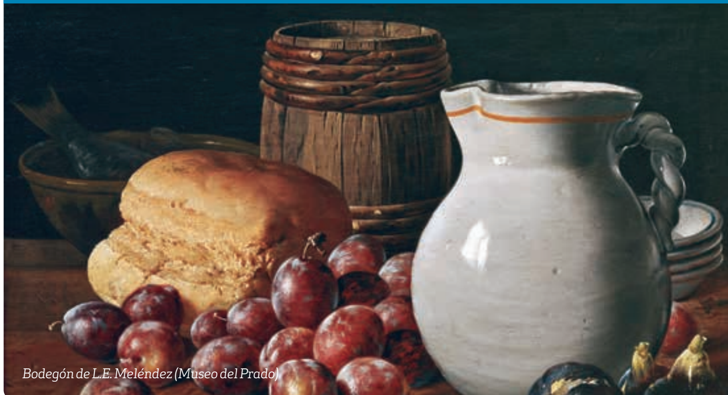
Bodegón de L.E. Meléndez (Museo del Prado)

p6 —Missatge del Sant Pare per a la Quaresma 2017