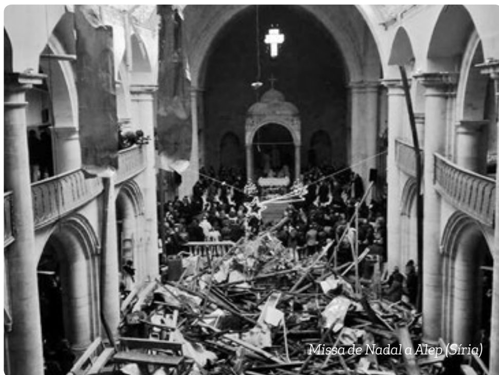
Missa de Nadal a Alep (Síria)

Fa dues setmanes, amb motiu de l'efemèride del centenari dels Pastorets de Josep Maria Folch i Torres, publicàvem una llista de poblacions dels bisbats de Vic i Solsona on es representen aquests o alguns de semblants d'altres autors. Ens vam des-cuidar Tàrraga, on al Teatre de l'Ateneu també s'hi realitzen i on compten amb una participació d'unes 165 persones.