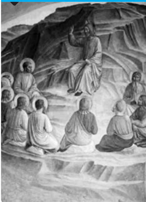
El sermó a la muntanya (1436-43). Fra Angèlic. Museu de Sant Marc de Florència.

Les benaurances, reflex de la vida de Jesús, són una invitació a fer-nos imitadors seus. Si ens deixem portar pel seu Esperit, descobrirem la felicitat que es troba compartint, essent humils, buscant la justícia i tenint el cor net. Aquesta felicitat no ens la prendrà ni la pobresa, ni el dolor, ni la persecució, i, a més, es projecta a l'eternitat.