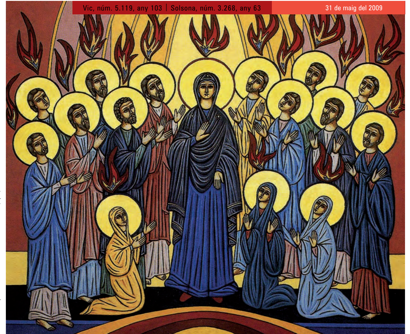
Detall d'una pintura mural. Catedral ortodoxa de Nicosia (Xipre)

En aquest món que dèiem, tantes vegades abocat a la frustració, presentar un missatge positiu, esperançat i d'amor com és el de l'Evangelí no pot ser alienant, sinó tot al contrari; perquè, com ens han dit força teòlegs, el Regne de Déu es comença a construir en aquesta vida, en la vida de cada dia. D'això en tenim múltiples models actuals i passats, amb la figura de Jesús com a centre de tots ells. Aquest ha de ser el nostre camí.