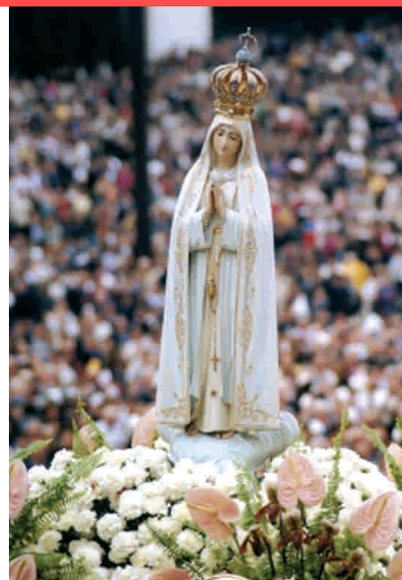
La Mare de Déu duta en processó per l'esplanada

Recordeu que, enguany, a Fàtima se celebra el norantè aniversari de les aparicions i que s'ha escollit com a lema pastoral Déu és amor misericordiós . Sobre la vida i activitats d'aquest santuari, es pot consultar www.santuario-fatima.pt (en portuguès).