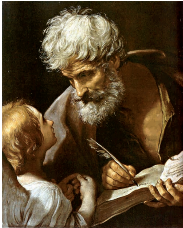
Sant Mateu i l'àngel, de Guido Reni (1575-1642), Pinacoteca del Vaticà

Igual que el blat (que és bona llavor) ha de conviure amb el jull (mala llavor) que ha sembrat l'enemic. Els qui som del Regne hem de saber viure en aquest món en el