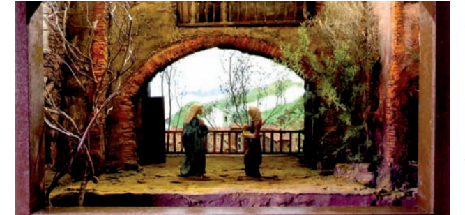
La Vistació de Maria.

El diumenge, dia 9 de desembre, des de la 10 del matí a les 6 de la tarda. A càrrec del P. Josep Vilarrúbias, claretia. Més informació al telèfon: 938850544 o bé per c/e: claretvic@claretvic.net.