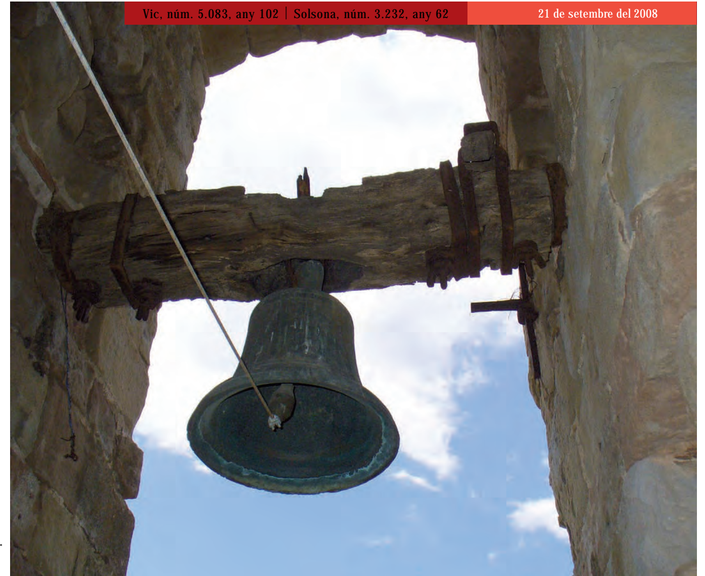
Campana del monestir de Serrateix.

La seva labor va ser silenciada pel comunisme durant molts anys. En el 2007, Polònia la va proposar com a candidata al Premi Nobel de la Pau. Irene Sendler és avui un testimoni viu de la confiança en Crist, algú que sentint-se salvada va salvar 2.500 nens de la mort. Mirar el rostre d'Irene és veure la bondat.