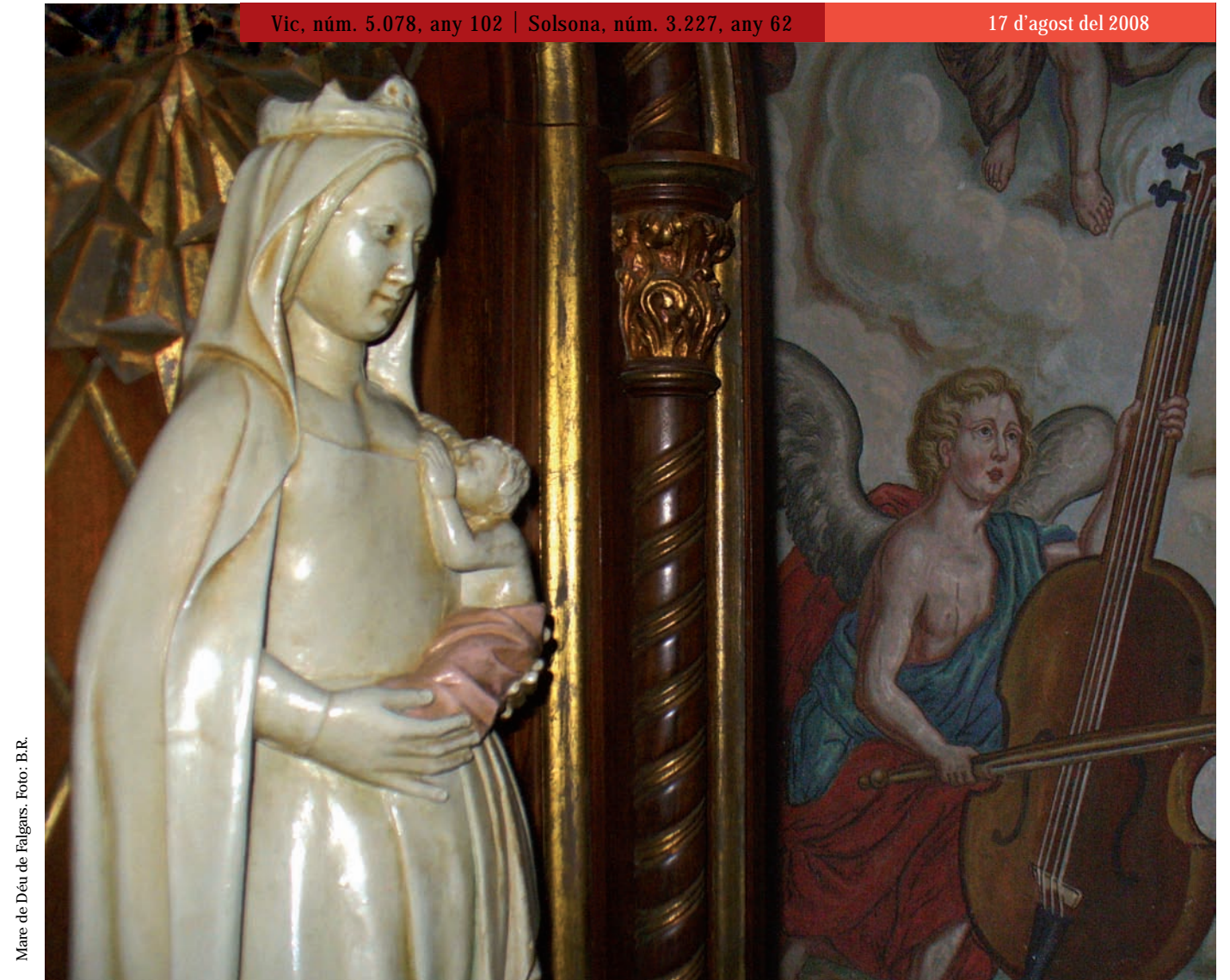
Mare de Déu de Falgans.

Sant Pau, en la primera carta als Corintis, tot parlant dels jocs olímpics, ho emprèn per un altre cantó: no apunta a la victòria efímera sinó eterna. La cursa que proposa als cristians té una finalitat molt diferent: córrer per assolir la vida eterna, i per això sí que val la pena fer el màxim esforç. Ens diu: «L'atleta s'absté de moltes coses, i tot per guanyar-se una corona que es marceix, mentre que nosaltres n'hem de guanyar una que mai no es marcirà. Així, doncs, jo corro, però no sense una meta; combató donant cops de puny, però no pas a l'aire. Tracto amb duresa el meu cos i el tinc dominat, no fos cas que, després de proclamar la victòria dels altres, quedés desqualificat jo mateix.» La cursa cap a Déu, igual com les curses en els Jocs Olímpics, també requereix molt entrenament, voluntat, constància, però hi ha una diferència substancial: no hi ha rivals ni competència. Tothom qui hi participa aconsegueix, amb el propi esforç i l'ajuda de Déu, la corona immarcescible de la glòria.