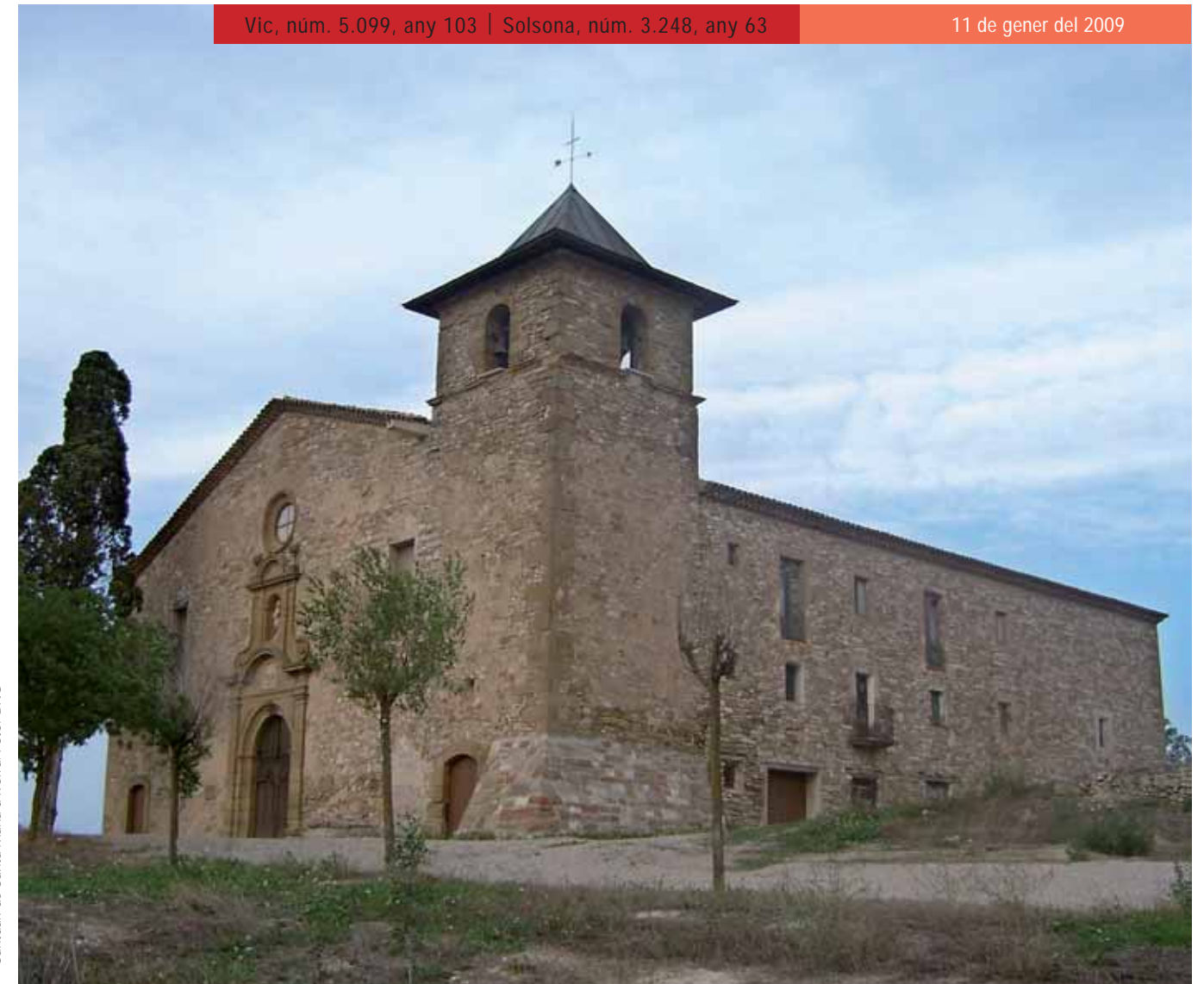
Santuari de Santa Maria d'Ivorra.

No hi haurà vida nova, de veritat, si no comencem per creure en nosaltres mateixos i en la necessitat (no sols possibilitat) de fer realitat els somnis i/o compromisos. Envellits i descreguts com ens hem anat tornant, ens cal recuperar la innocència i la gosadia dels infants si volem transformar de debò aquest nostre món tan trist, tan injust, tan violent, tan poc humà, i aquesta nostra mateixa Església tan decebedora. Només havent renascut amb l'Infant de Betlem, o creient si més no en la bondat de les persones, podrem felicitar-nos de cor: Any Nou, Vida Nova!