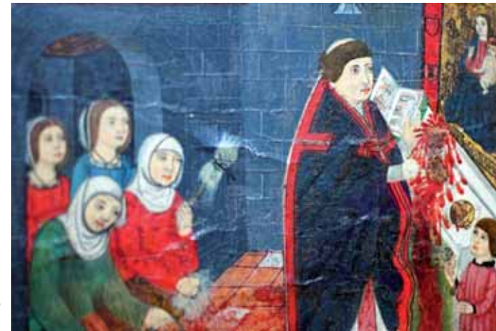
Imatges del retaule

La devoció al Sant Dubte d'Ivorra s'estengué principalment gràcies a la Confraria de Santa Maria. A finals del segle XII és fundat el Real Monestir de Religioses Sanjoanistes Creuades a Sigena, a la província d'Osca (Aragó) per Sancha, dona del rei Alfons II, amb l'aprovació del papa Celestí III. En la seva fundació s'hi van aportar unes relíquies del Sant Dubte, consistents en una porció de les estopes