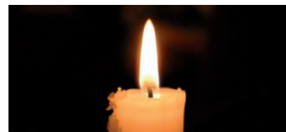
Detall del cartell del Dia de Germanor

O sigui que els difunts no són morts sinó més vivents que nosaltres i ens estimen com mai, participant com participen de la glòria de Jesús, el Senyor Ressuscitat, ells ja de ple, nosaltres només en realitat esperançada. Els morts, ai las!, som nosaltres, encara que no ho sembli, si és que no estimem de cor. Solament l'Amor és Vida. Com més estimem, més vius, ja ara i per tota l'eternitat.