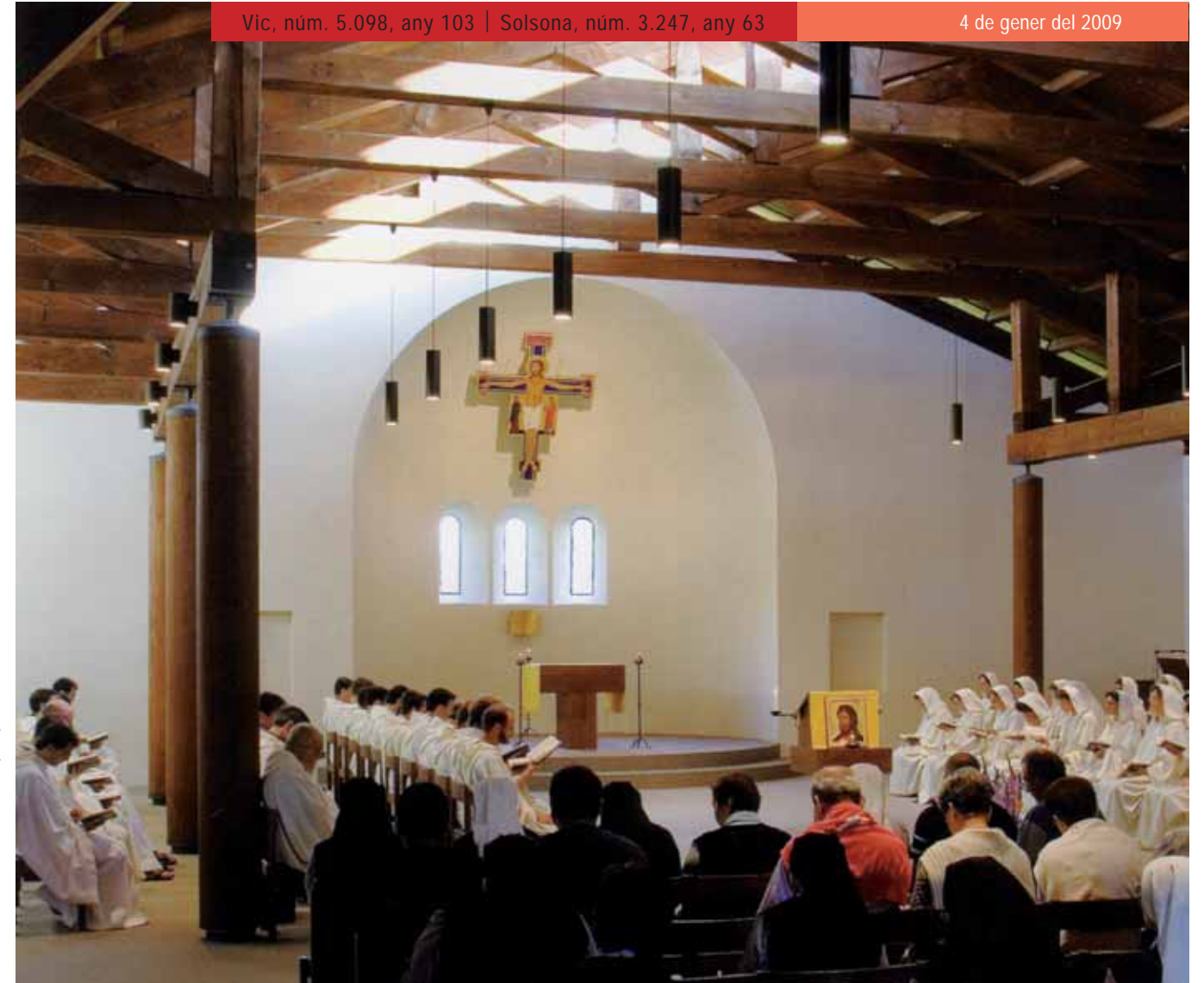
Comunitat monàstica de Bose (Itàlia)