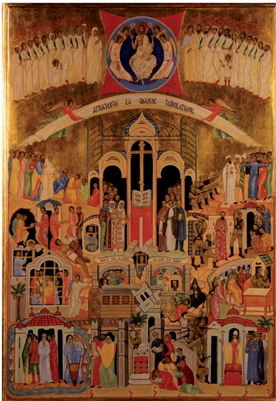
«Nous màrtirs», retaula pictòric de l'església de Sant Bartomeu de Roma.

La bellesa és reveladora de Déu. Tota bellesa. També ho és, no cal dir-ho, la natura, qualsevol paisatge, el somriure del sol o la claror de la lluna.