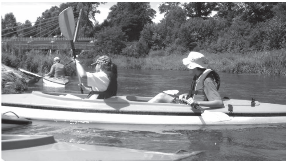
Diverses fotos del pelegrinatge a Polònia (juliol 2009)