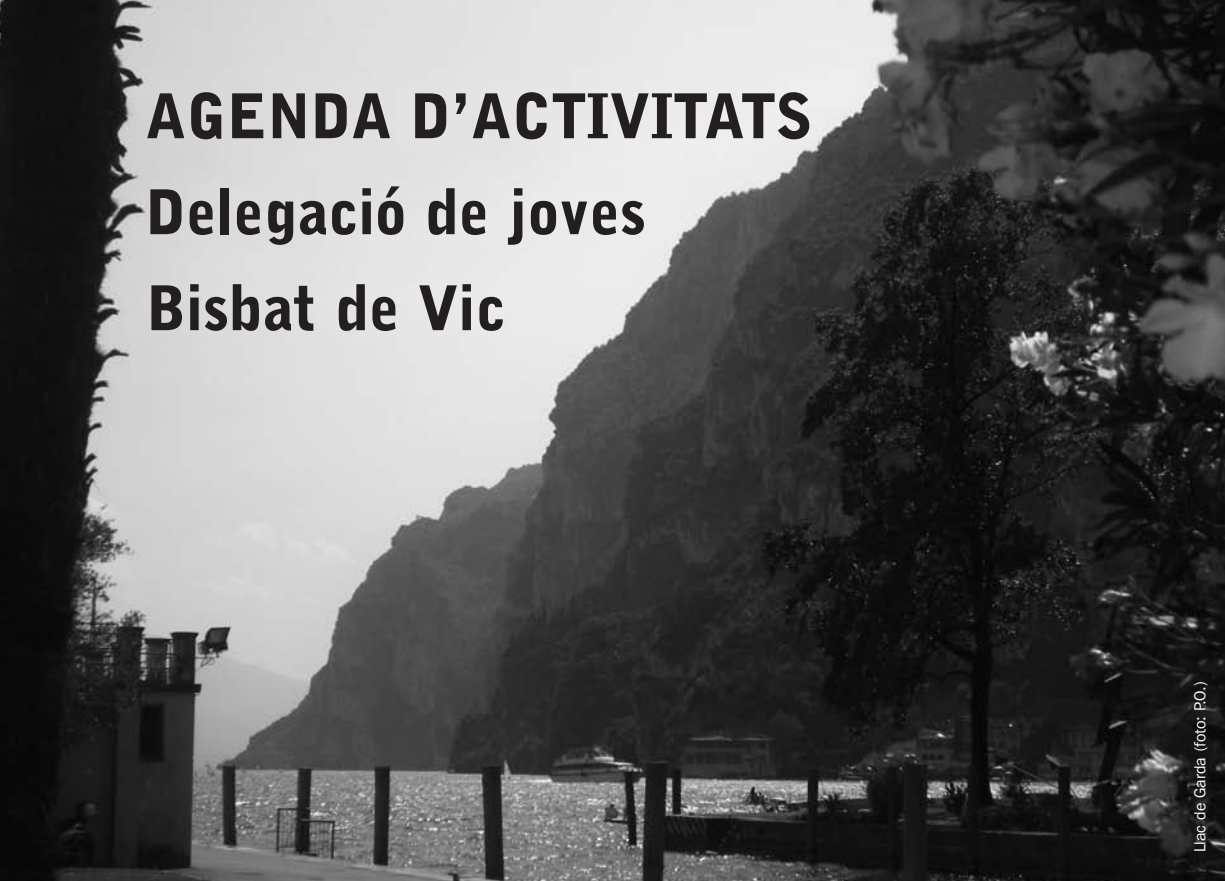
Llac de Garda

■ Dissabte 28 de novembre Trobada de joves de més de 17 anys