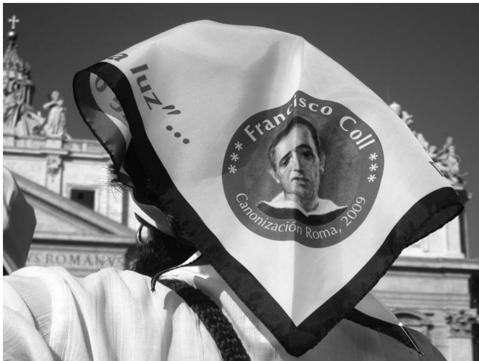
Missa de canonització a Roma.