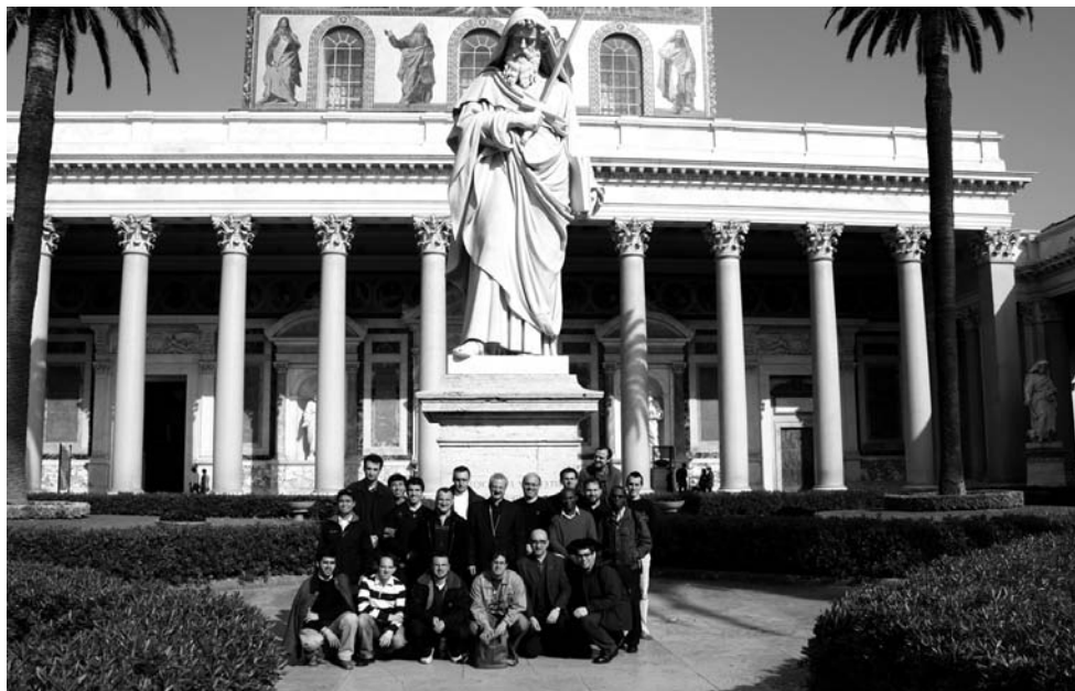
Seminaristes a la basílica de Sant Pau Extramurs