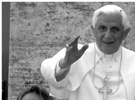
El Papa Benet XVI

Altres visites aquests dies a Roma, han estat: les Catacambes de Sant Sebastià, Sant Anselm, Sta Sabina, Sta Maria in Cósmedi. També Sta Maria del Trastevere, Isola Tiberina. Així com altres indrets de la ciutat. Algun passeig per la Roma antiga i les famoses places barroques de la ciutat santa. Cinc dies que han donat per molt!