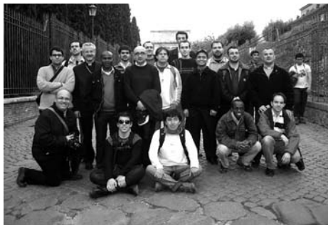
Pels carrers de la Roma antiga