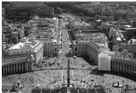
Plaça del Vaticà