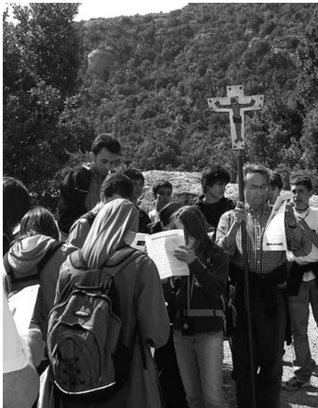
Viacrucis a Montserrat (abril 2009)