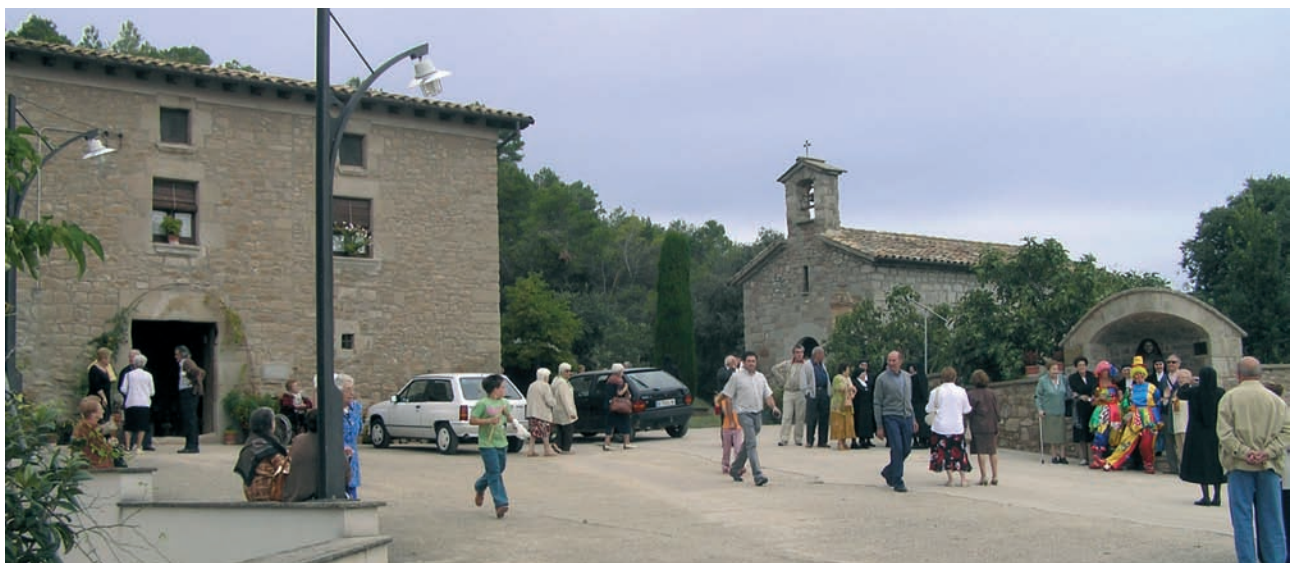
Casa natalícia i capella de Sant Nazari (setembre 2006)