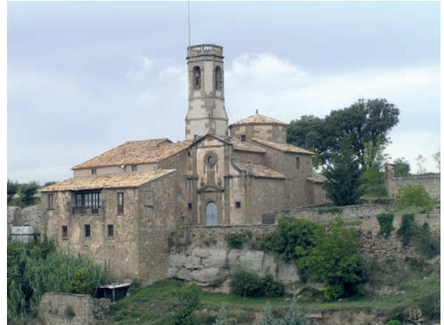
Església parroquial de Santa Eulàlia de Pardines (setembre 2006)

De la primera etapa cal subratllar la senzillesa, la sobrietat i la pietat. Els seus pares eren masovers, no propietaris, de la masia de Sant Nazari. Tingueren onze fills. Demés, els tocà de viure una època en què Catalunya, especialment la Catalunya rural, patia els estralls de les guerres carlines, especialment actives al Lluçanès. La nostra heroïna va créixer en aquest ambient d'escassetat i sobrietat. De molt petita va haver de treballar ajudant la mare a les feines de la llar i també pasturant el ramat d'ovelles de la casa. Això sí, el fragor de la guerra no