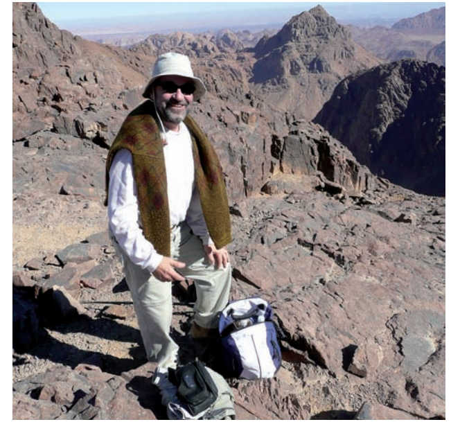
Camí del pic de Santa Caterina.

No cal dir que tinguérem estones comunitàries d'explicació, comentari, tertúlia i celebració. Rellegírem l'Èxode i férem comentari de tots els seus miracles, començant per les plagues d'Egipte, el pas del Mar Roig, les aigües de Mara, el manà, les guatlles, l'aigua de la roca, l'esbarzer incandescent, la muntanya cremant en la teofania del Decàleg, els textos d'Egèria, i recordàrem el pas del monjo montserratí Bonaventura Ubach per aquest monestir. Vam visitar alguna ermita de la mun-