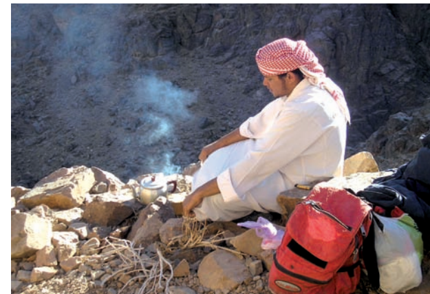
El guia preparant el te.

La primera nit ascendírem el Gebel Musa en llarga processó convencional de turistes, camells, pelegrins, beduïns i llanternes. L'espera al cim fou de molt fosca i fredor. Un cop el sol féu la seva aparició, no tinguérem cap pressa a baixar. La gentada que teníem a l'entorn anava davallant per l'estret viarany de baixada; era com un gran embut que no acabava d'engolir l'allau de gent tan diversa. Assaborírem la muntanya en la seva transformació lumínica segons el sol anava enlairant-se. Des de l'ermita de la Trinitat, al cim del Gebel Musa, a horitzó obert, contemplàvem embadalits la grandària pètria del muntanyam sinaític. Des de les carenes del sistema endevinàvem també el curs dels wadis El-Arbaein, Shrayij i Ferrah, que dos dies més tard trepitjaríem per ascendir al pic de Santa Caterina, quatre-cents metres més alt encara que la muntanya de Moisès.