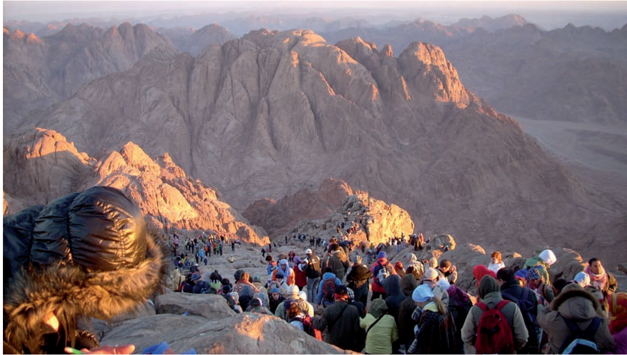
Baixant del Gebel Musa.

L'ascensió al Gebel Musa del Sinaí , la muntanya de Moisès, per veure la sortida de sol qualsevol dia de l'any és ja un dels objectius que figuren a l'agenda de les agències de viatges egípcies, sobretot si tenen interessos en les instal·lacions turístiques de la península triangular del Mar Roig, entre els golfs de Suez i Àkaba. El proppassat novembre, concretament, ens vam trobar no menys de sis-centes persones als entorns perillosos del cim, no al cim ben bé, perquè literalment no hi cabíem. Tenim una expressió en la nostra llengua que indica aquestes situacions massives: «Sembla la Rambla.» Doncs la pujada al Sinaí avui dia, si no és per sortosa excepció, sembla la Rambla. Els guies beduïns que ens menaven asseguraven que això és quasi tot l'any i que és la seva vida.