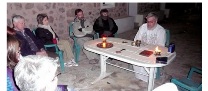
Durant la celebració de l'eucaristia.

La pregària , amb la Bíblia i els Apotegmes del Pares a la mà, i la celebració eucarística hi foren presents cada dia, eren els moments més forts de la jornada. El temple eren les imponents muntanyes de l'entorn, per cúpula teníem el cel i les estrelles, amb la brillantor de nit de desert, eren les llànties.