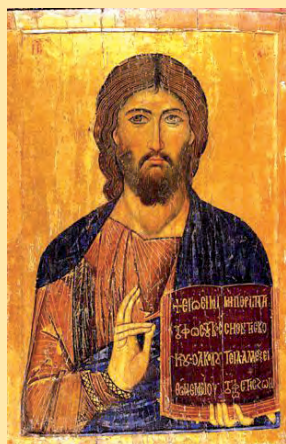
«Molt aviat sereu alliberats»

► Apostolat de l'oració. Us recordem que les intencions del Sant Pare per al mes de desembre són les següents: General : Perquè els nens siguin respectats, estimats i no siguin mai explotats de cap manera. Missionera : Perquè durant el Nadal els pobles de la terra reconeixin en el Verb Encarnat la llum que il·lumina tota la humanitat, i les nacions obrin les portes a Crist, Salvador del món.