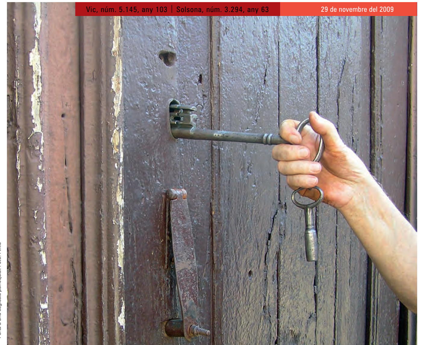
Porta d'una església parroquial.