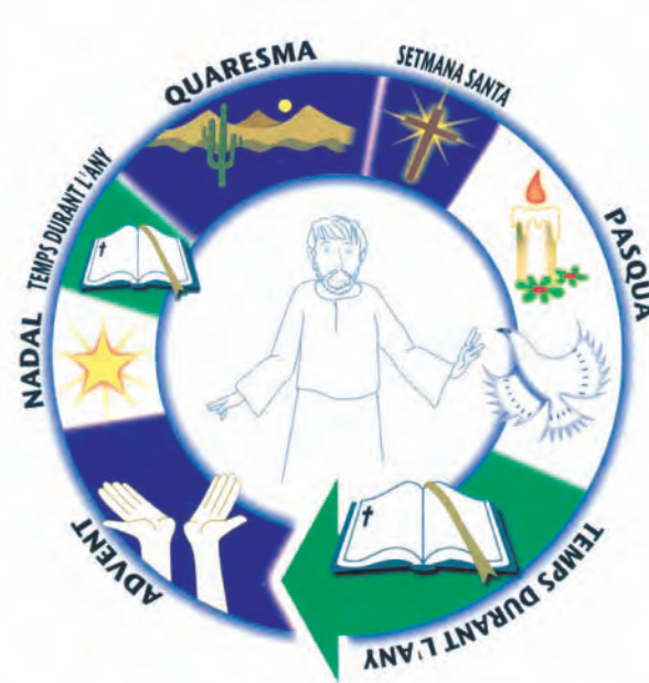
Del llibre Cada diumenge Jesús et convida (Editorial Claret)

L'Esperit i el perdó van junts en l'Evangeli de Joan (Jn 20,22-23). No és estrany que Lluc sigui també l'evangelista del perdó que ens dona episodis de gran bellesa, com el de la pecadora als peus de Jesús (Lc 7,36-50); i, en la Passió, la mirada a Pere (Lc 22,61), el perdó del crucificat als seus mateixos botxins (Lc 23,4) i al bon lladre (23,42-43).