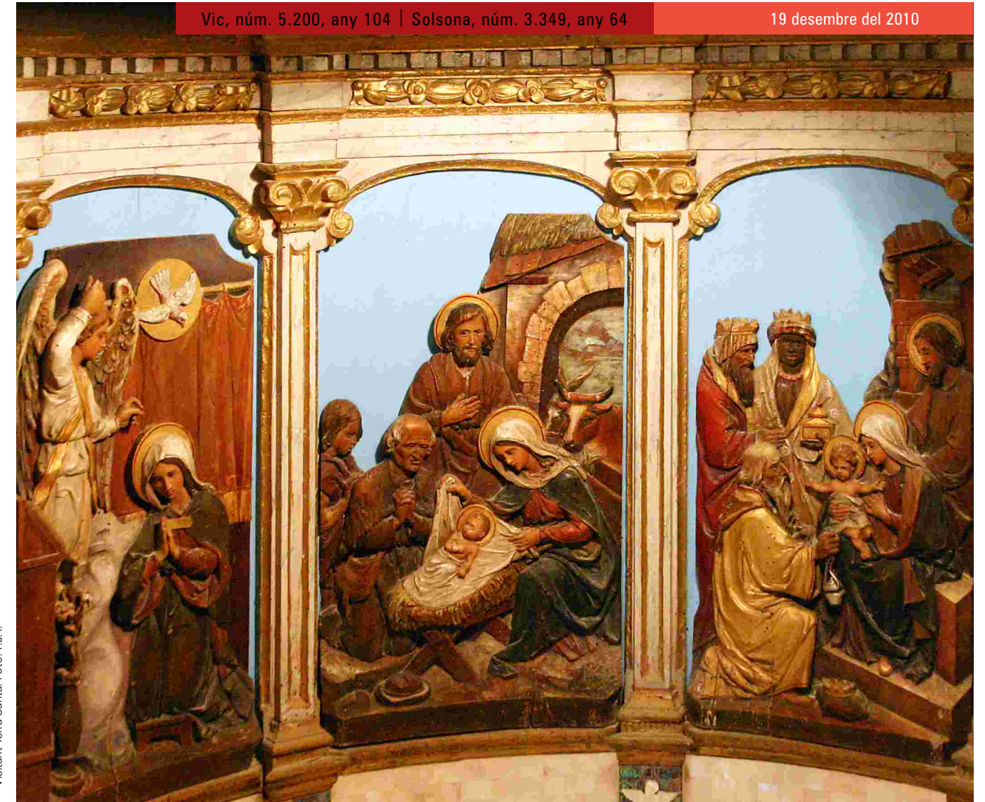
Visitant Terra Santa.

El gran teòric de l'esperança, Ernst Bloch, va escriure en el seu llibre El principi esperança : «cal aprendre a esperar». Encara que la seva esperança (marxisme) i la nostra (cristianisme) siguin diferents tenia molta raó quan parlava de la pedagogia de l'esperança. L'Advent és el moment idoni per exercitar-nos a aprendre a regenerar la pròpia esperança en el Salvador que ha de venir, i analitzar si realment som testimonis d'aquesta esperança enmig del món.