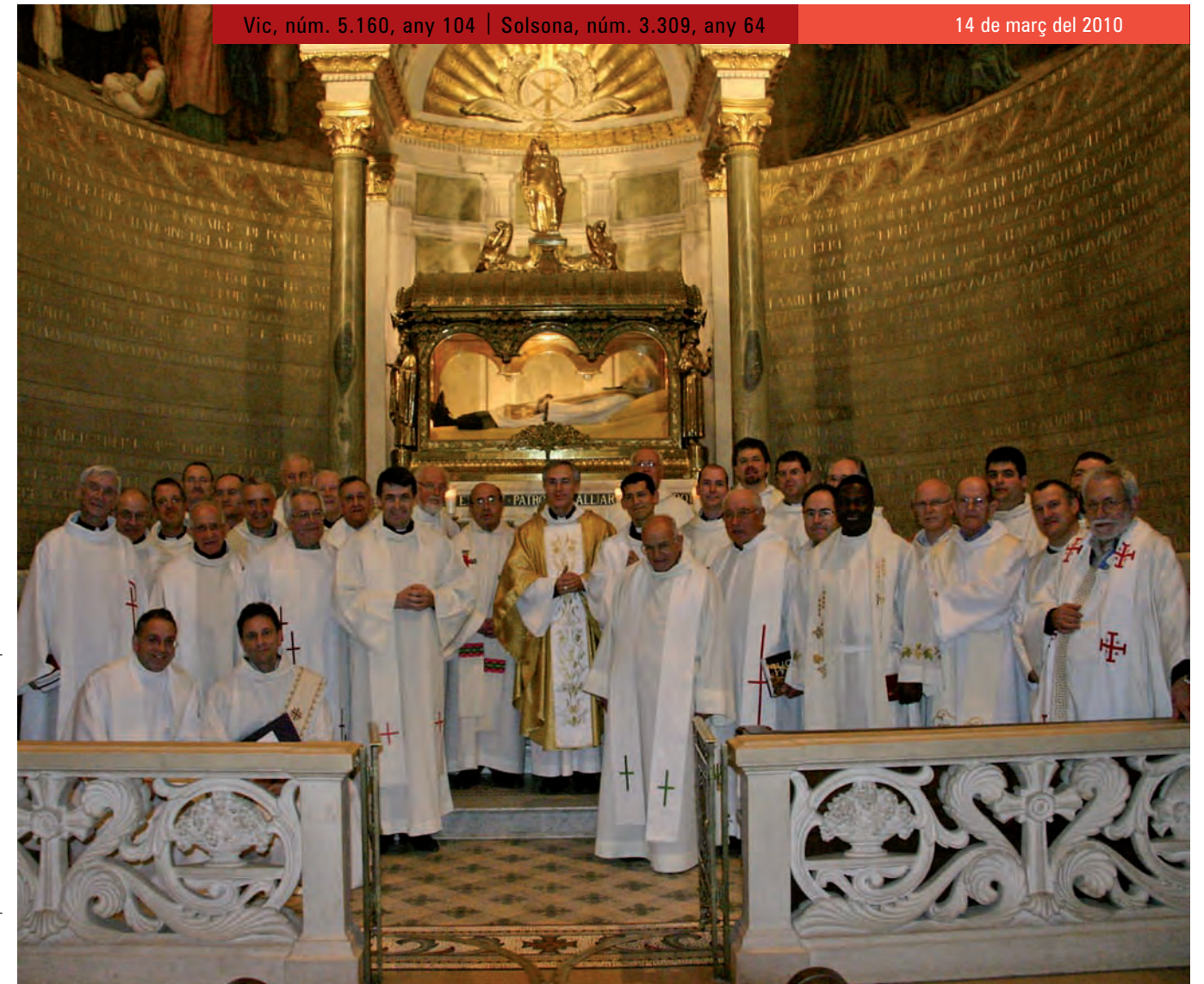
Bisbe i preveres del bisbat de Vic davant el sepulcre del rector d'Ars.

Bones reflexions a fer-nos arran d'aquest Any Sacerdotal i del tradicional Dia del Seminari celebrador diumenge vinent. Hem de pregar, sí, i molt, però amb la sola pregària no resoldrem la gravíssima crisi de vocacions que hi ha en l'actualitat.