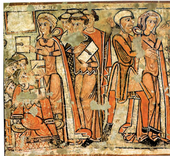
Disputa i arrest de santa Caterina

—El tercer: Un conjunt retrobat dispers . Aplega els tres fragments de l'obra. En primer lloc, la Disputa i arrest de santa Caterina mostra el triomf dialèctic de la santa contra els pagans i estableix un paral·lelisme amb el conflicte entre els càtars i els frares dominicans en el segle XIII. Per la seva banda, el martiri de santa Caterina podia fer referència a la mort dels màrtirs dominicans a mans dels de-