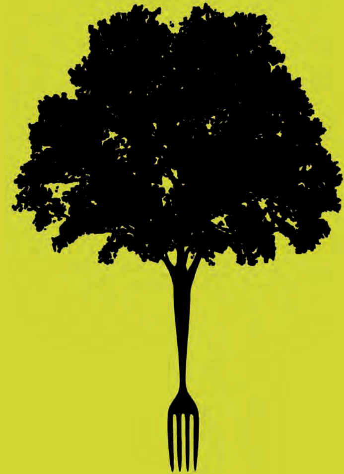
Detall del cartell de la campanya de Mans Unides