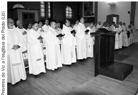
Preveres de Vic a l'església del Prado (Lió)

sament per a la diada: La Festa de la Purificació de Maria i Presentació del Senyor al Temple. Després d'entrar, a través d'un molt ben fet i complet audiovisual, en la vida de Joan Maria Baptista Vianney, cap a la basílica. La missa de la festivitat al poble, comptà amb la presidència del nostre bisbe amb nosaltres com a concelebrants. La celebració començà davant l'església, acaronats per una barreja de sol que començava a eixir i fred intens. L'homilia la féu el vicari episcopal de la diòcesi (en temps del sant rector era la de Lió, ara pertany a la que es creà amb el nom de Belley-Ars) remarcant la consagració especial de preveres i religiosos. Al final de la celebració, aquest mateix mossèn agrai la disponibilitat d'acollida del nostre Bisbat envers els joves del seu que és previst participin de la Jornada Mundial de la Joventut del 2.011 a Madrid; li havia