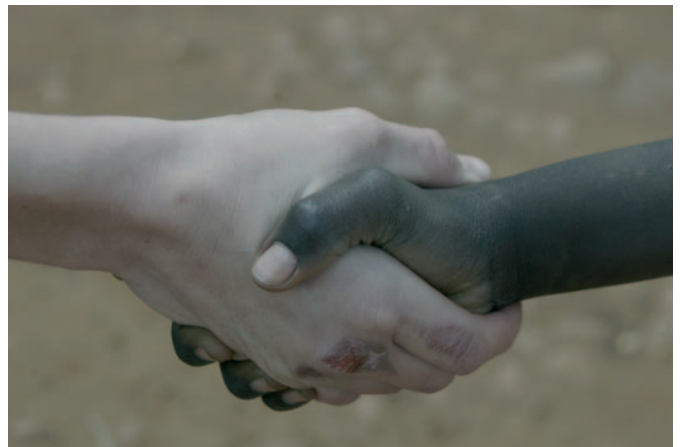
Encaixada de mans entre un noi ruandès i un de català

Viure l'amor i, així, portar la llum de Déu al món: a això voldria convidar aquesta encíclica.