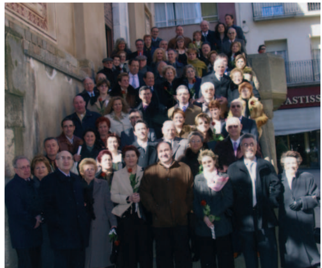
Matrimonis homenatjats en el present any.

Al migdia, tothom es reuní en un llarg dinar de germanor, on no va faltar el diàleg alegre i amical amb mil anècdotes per explicar. Nota simpàtica fou que a la sobretaula es projectaren fotografies del dia del casament de cada parella, cosa que portà molt agradables records a tothom.